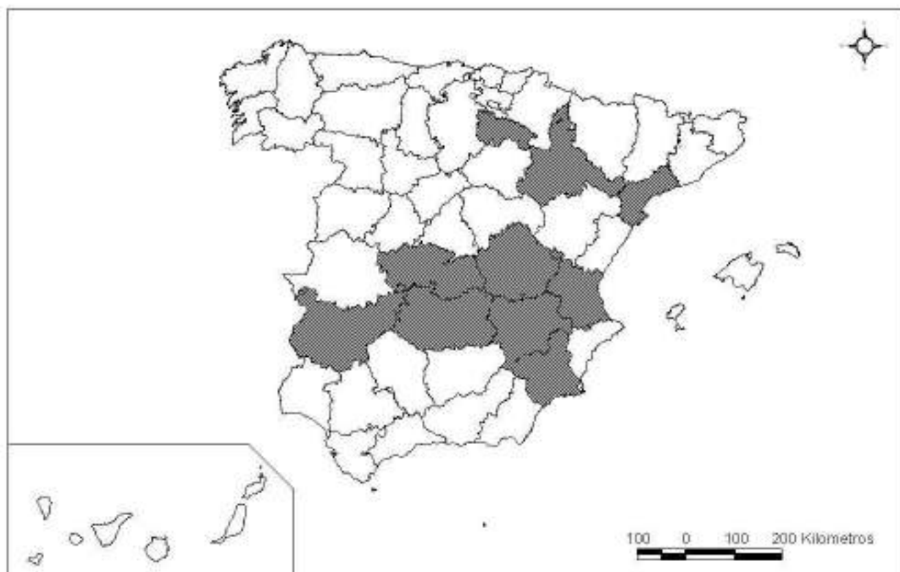
PROVINCIAS CON MÁS DE 25.000 HECTÁREAS DE VIÑEDO DE SECANO (1999)