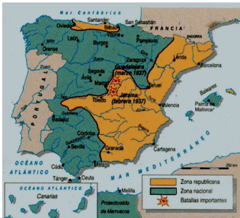
La guerra civil española: situación del frente en marzo de 1937.

FUENTE HISTÓRICA: Relacione el mapa siguiente con el desarrollo de la guerra civil española.