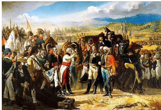
Cuadro. La rendición de Bailén . Autor: Casado del Alisal.