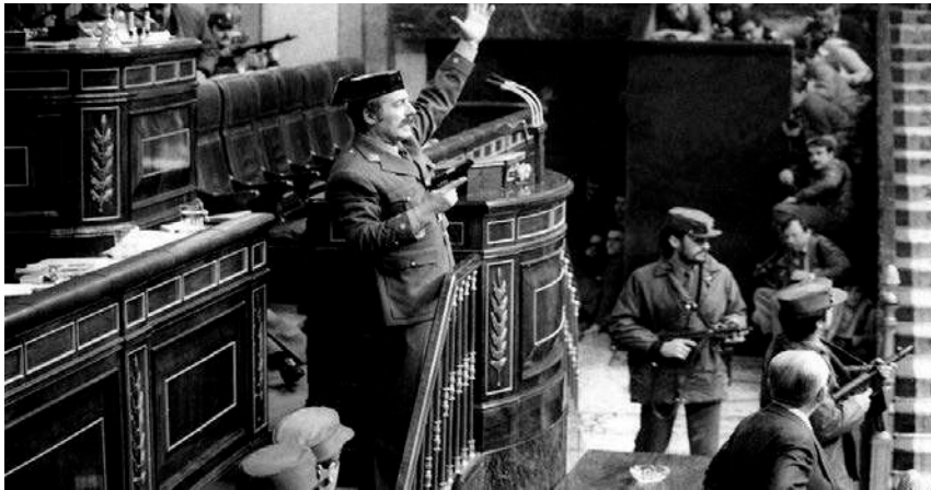
Teniente Coronel Antonio Tejero en el Congreso de los Diputados.