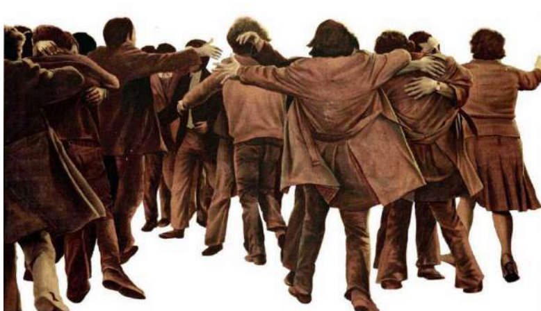
Cuadro El Abrazo , Juan Genovés.